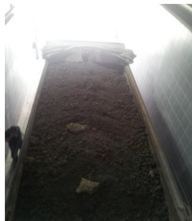
מכולה טעונה בבמס"א