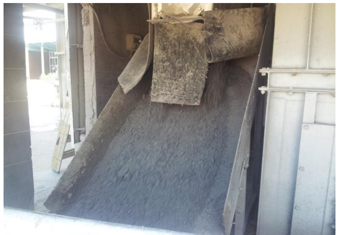
במס"א ביציאה מהמערבל