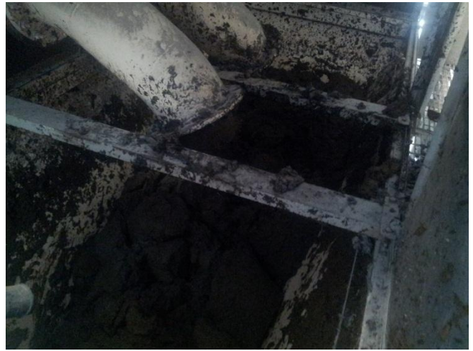
בוצה סחוסה בכניסה למתקן