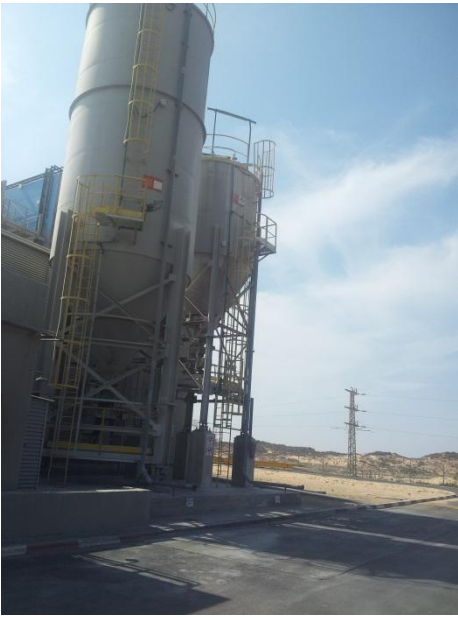
מוספים: אפר מרחף וסיד