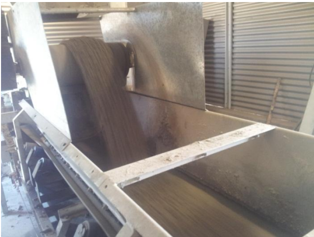
במס"א במסוע להטענה